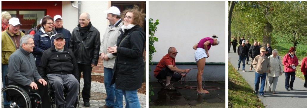
Eindrücke der Aktivtage 2012